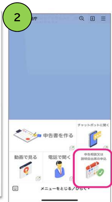
説明会の申込を選択