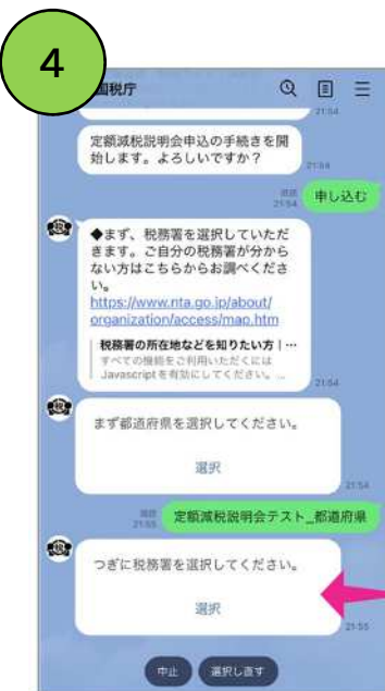
都道府県及び署の選択