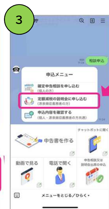
定額減税の説明会选择