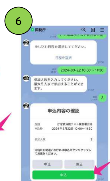
「申込」をタップして完了