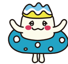
ロンビーくん (大磯ロングビーチ マスコットキャラクター)