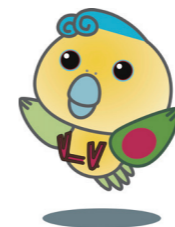
いそべえ (大磯町観光キャラクター)