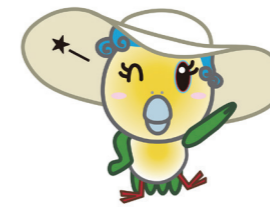
あおみ (大磯町観光キャラクター)