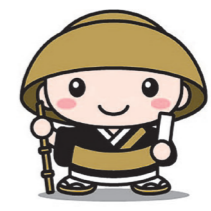
えんいくん (鶴立庵大使)