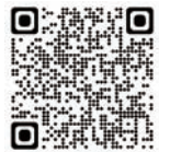
小規模事業者 持続化補助金 (商工会地区)

※IT導入補助金については、免税事業者だけではなく従来から課税事業者であった事業者も給付対象となっております。