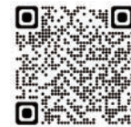
小規模事業者 持続化補助金 (商工会議所地区)