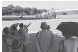
金沢城公園を見学