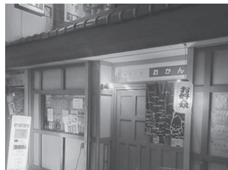
南林間駅の西口から徒歩約3分のお店

ましたが、お受けすることにしました。今では先輩役員の方々と仲良く楽しく務めさせていただいております。本当に良かった。今の素直な気持ちです。 これからも頑張ってまいりますので、よろしくお願ひします。