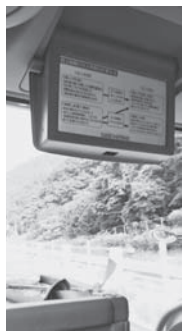
バス車内での研修

う必要がなかった事業者も申告・納税しなければならぬ場合もあるようですが、この制度自体を知らない事業者もまだ多いのではないのでしょうか。