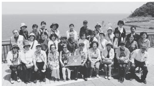
第1班1号車の皆さん（能登輪島・千枚田にて）

そのあとは能登半島を下り、穴水町へ。のと鉄道・穴水駅で青色申告会のシンボルマークを取り付けた貸切車両に乗り換え、名物ガイドさんの話と車窓から見える能登の里山里海を楽しんでいただ