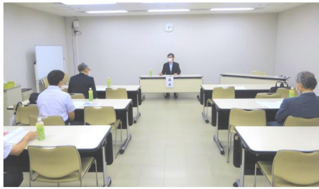
神奈川県連 青年部総会