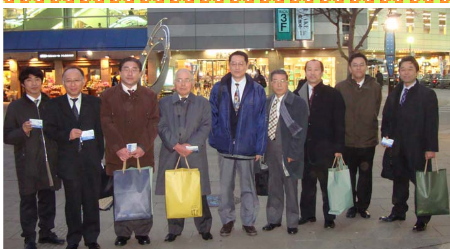
応援にかけつけてくれた署幹部職員、親会役員と参加メンバーで大和駅前にて