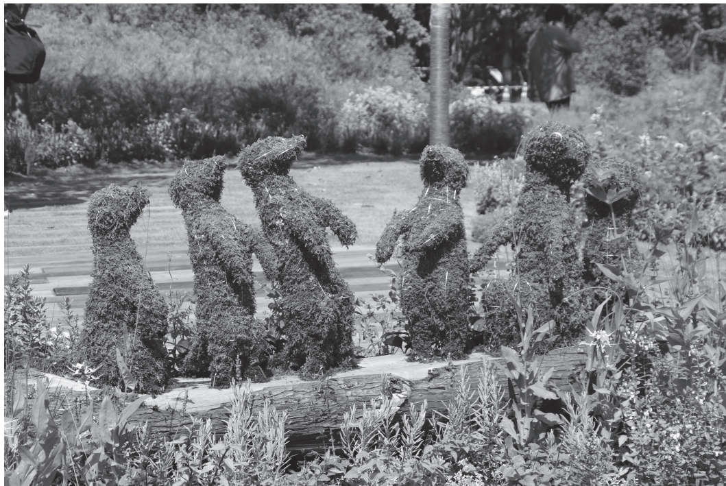
里山ガーデン(旭区)