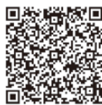
記帳・帳簿等の保存制度

個人事業者の記帳・帳簿等の保存制度や、加算税の加重措置に関するQ&Aについては、国税庁ホームページをご覧ください。