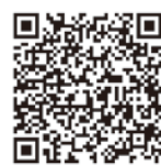
加重措置に関するQ&A