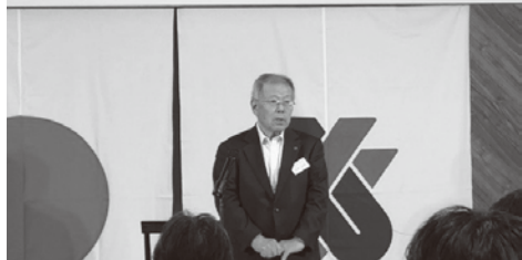
団法人保土ヶ谷青色申告会