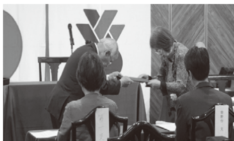
第27回 定時総会 一般社団法人保土ヶ谷青色申告会