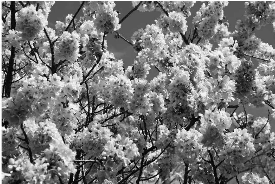
春めき桜(南足柄市)