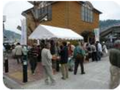
▲御殿場線まつり会場