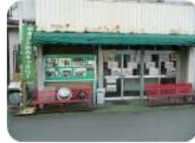
▲やまきた街角ギャラリー