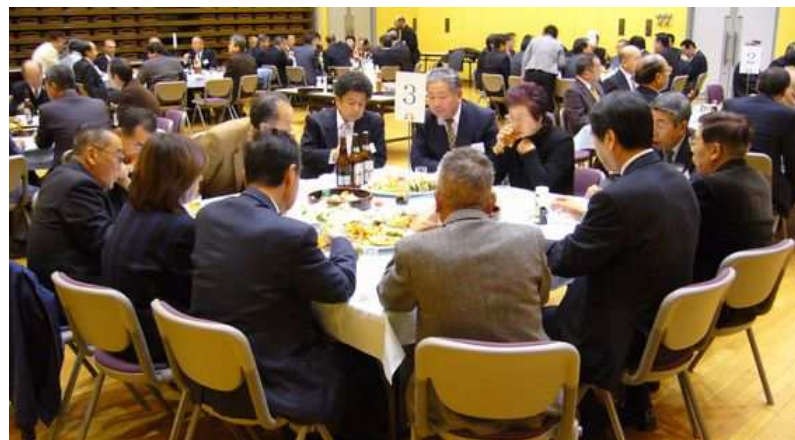
▲賀詞交歓会場の様子