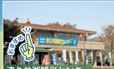
津久井湖観光センター