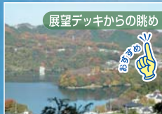
展望デッキからの眺め