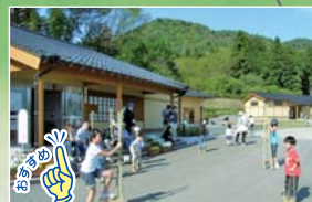
津久井湖城山公園パークセンター