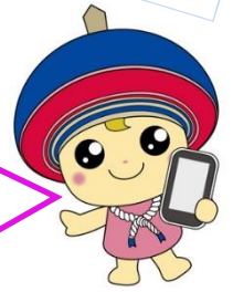
伊勢原市公式イメージキャラクター クルリン

お店や観光地で インスタパネルを探して ハッシュタグ『#伊勢原』を つけて投稿してね♪