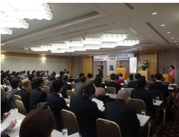
全青色青年部研究集会