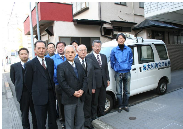
広報車宣伝活動 出陣式