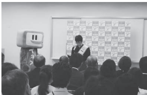
税務職員等を前に受賞作文を朗読