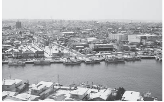
雪の八戸港・新井田川河口

夫の生家は八戸。旧市街と港町の中間にある小中野町で、今は旅館になっていますが、3階建ての遊廓が残る旧い町です。生後間もない赤児を抱いて八戸へ帰されたこと、よく覚えております。子ども2人は小学校入学までの