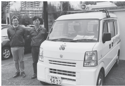
昨年も広報車で巡回しました

さて、青年部は今年も確定申告期に広報車に乗って巡回します。一般の方も含めて確定申告の周知になると思います。4市5地区を各地区の役員さんと分担し、安全運転で巡回してまいりますので、応援?のほどよろしくお願いいたします。