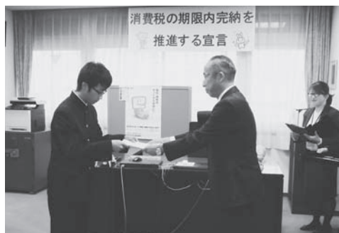
香野署長から委嘱状が渡される

中学生の「税についての作文」は、全国7464校の中学校から57万8024編の応募があり、大和税務署管内では、20校から1317編が応募された。