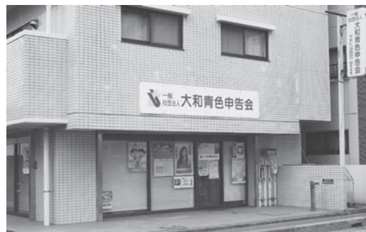
大和青色申告会 事務局

一般社団法人大和青色申告会 は、大和税務署管内(大和市、座 間市、海老名市、綾瀬市)の青色 申告者によって組織された健全な 納税者団体であり、約5千8百名 の会員の中から選任された役員が 無報酬で会運営にあたっておりま す。 記帳や決算の指導、金融斡旋の ほか、研修旅行・生活習慣病健診・ 各種共済等の福利厚生事業も行い つつ、公平で合理的な税制の確立 を目指して活動しております。