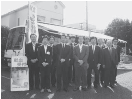
大和税務署駐車場にて

最後になりますが、今回ポスターの掲示や広報にご協力いただきました皆様には心より御礼申し上げます。