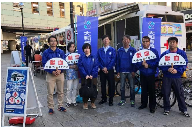
小田原青色申告会青年部の皆様と