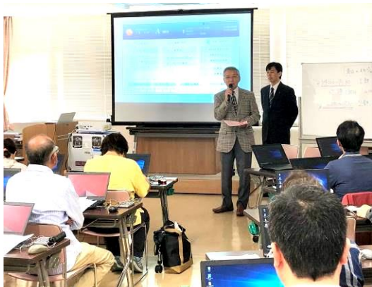
吉川会長よりご挨拶いただきました。