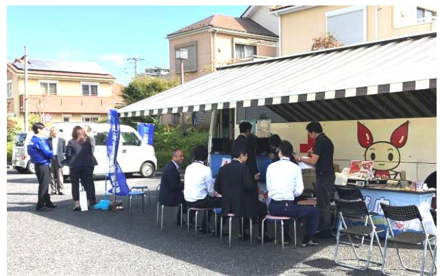
大和税務署駐車場での街頭献血風景

街頭献血の呼び掛けを実施! 採血人数は過去最高を記録 10月9日(水)今年も毎年恒例になりました街頭献血のお手伝いを行いました。当日は少し風が強かったのですが晴天に恵まれて絶好の献血日和になりました。雨模様の天候では受付人数も減ってしまっています。街頭献血では天候は重要な要素の一つです。この3日後に台風19号が関東・東北を襲い大きな被害を出したの皆さんご存じだと思います。台風当日はもちろんその後にも街頭献血を行うには難しい日が続いたため血液の供給に支障