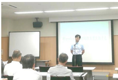
下田部長より 開会のあいさつ

個人事業者には厳しい秋となりそうですが、できることといえば早めの対応を心掛けるしかなさそうです。