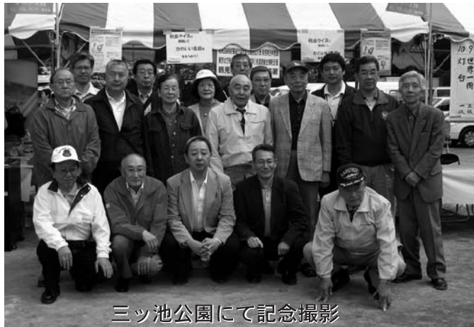
三ツ池公園にて記念撮影

三ツ池公園 フェスティバルに参加 去る、5月15日土曜日 三ツ池公園に於いて開催された『三ツ池公園フェスティバル』に参加しました。 当日は、多くの会員さんや近所の方が会場を訪れました。 鶴見税務署並びに納税協力六団体の出店では、税に関する広報活動を行いました。