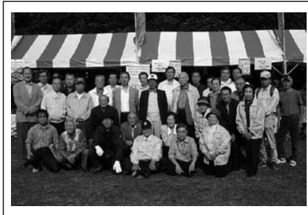
つるみ臨海フェスティバルにて記念撮影