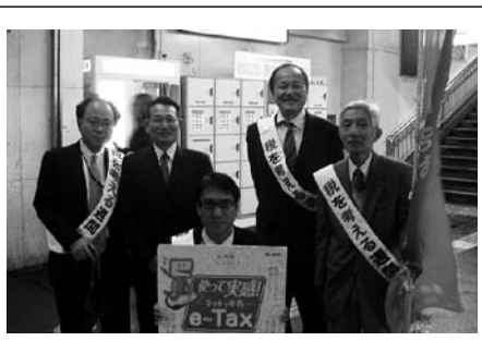
鶴見駅西口にて広報活動(11/11)