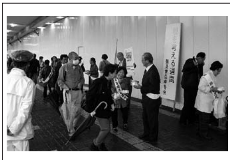
鶴見駅東口にて広報活動(11/11)