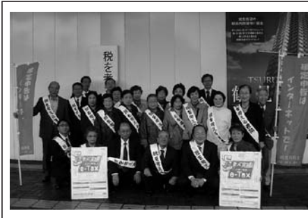
鶴見駅前広報活動の記念撮影(11/11)