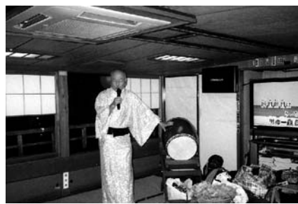
カラオケを楽しむ著者