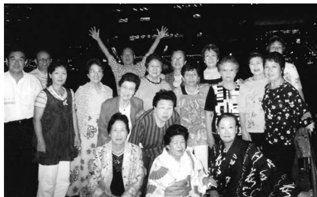
夜景をバックに全員集合!