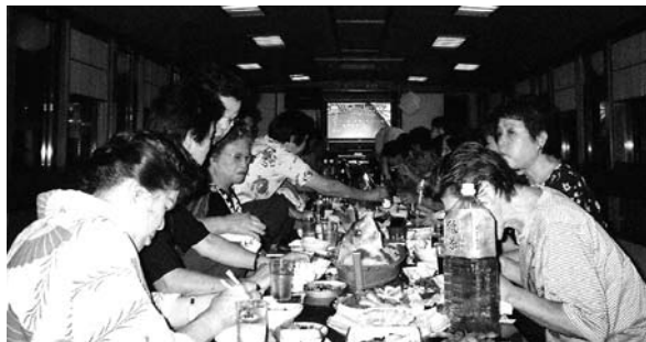
豪華な料理の数々に驚き