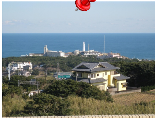
地球の丸く見える丘展望館

銚子市内で一番の高台からの360度の大パノラマが広がり、緩やかに弧を描いた水平線がご覧いただけます